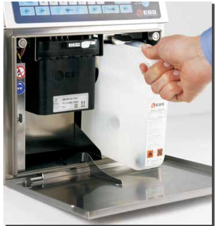
Einfacher, tropffreier Flaschentausch Easy, drip-free bottle change, no spillage!

The Continuous Ink-Jet Printer EBS 6500 „Boltmark“ series for non-pigmented inks is the new reference for mobility, comfort, uptime and customer service friendly.