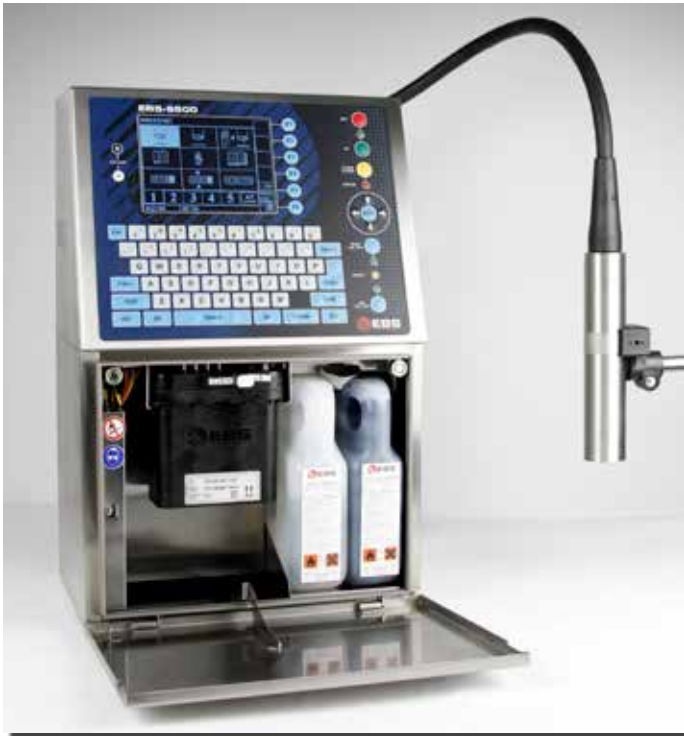
Innen aufgeräumt und leicht zugänglich Easy access

Der Continuous Ink-Jet Drucker Serie EBS 6500 „BOLTMARK®“ für pigmentlose Tinten ist die neue Referenz für Mobilität, Komfort, Betriebssicherheit und Servicefreundlichkeit.