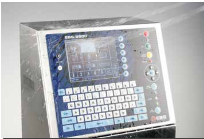
IP54 Schutzklasse - rostfreier Edelstahl IP54 protection class - V2A stainless steel

1-2-3 „iModule®“: Sie benötigen nur 1 Minute. Ohne Werkzeug. Ohne Schmutz. Ein vorbeugender Service den jeder selbst machen kann. Das ist preiswert, schnell und unkompliziert.