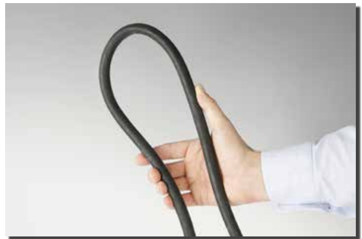
Superflexibler Schreibkopfschlauch Ultra-flexible umbilical cord